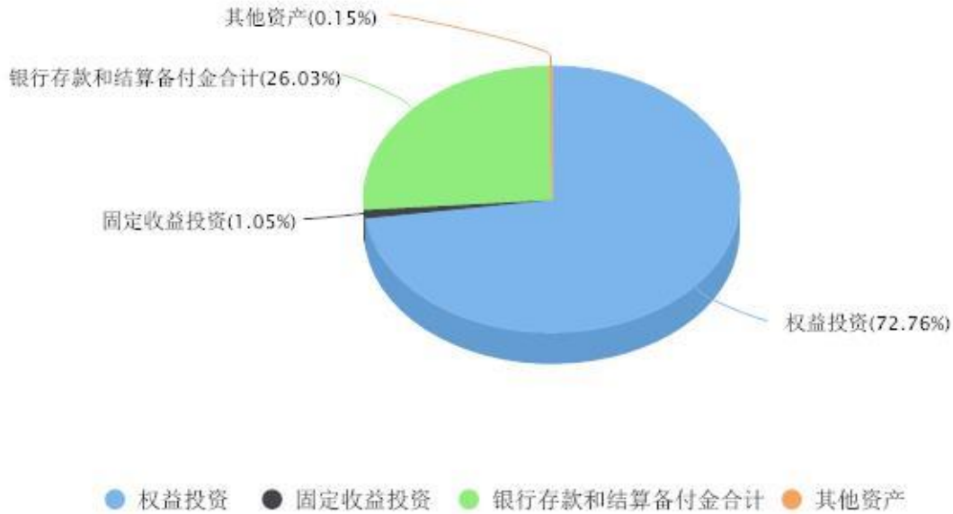
投资组合资产配置图表 数据截止日期:2024年06月30日