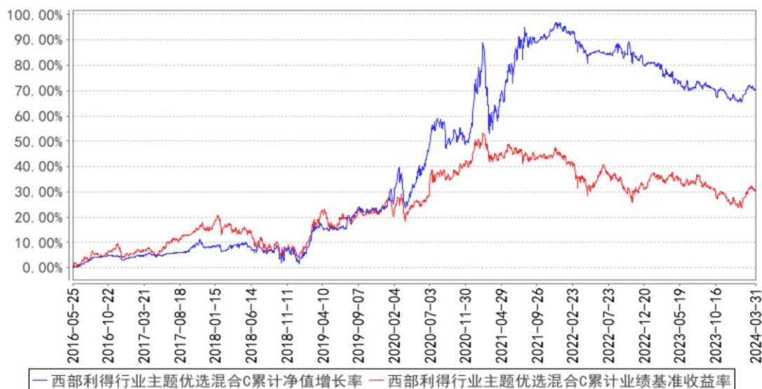
西部利得行业主题优选混合C累计净值增长率与同期业绩比较基准收益率的历史走势对比图

2) 西部利得行业主题优选灵活配置混合型证券投资基金 C（2016年05月25日至2024年03月31日）