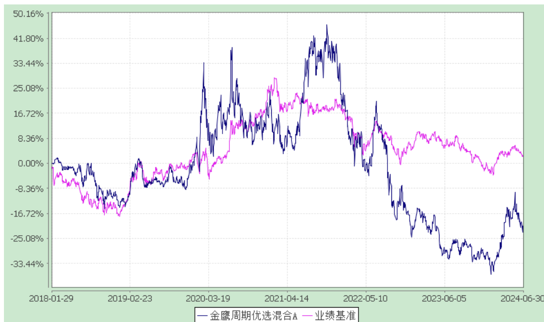
金鹰周期优选混合 C: