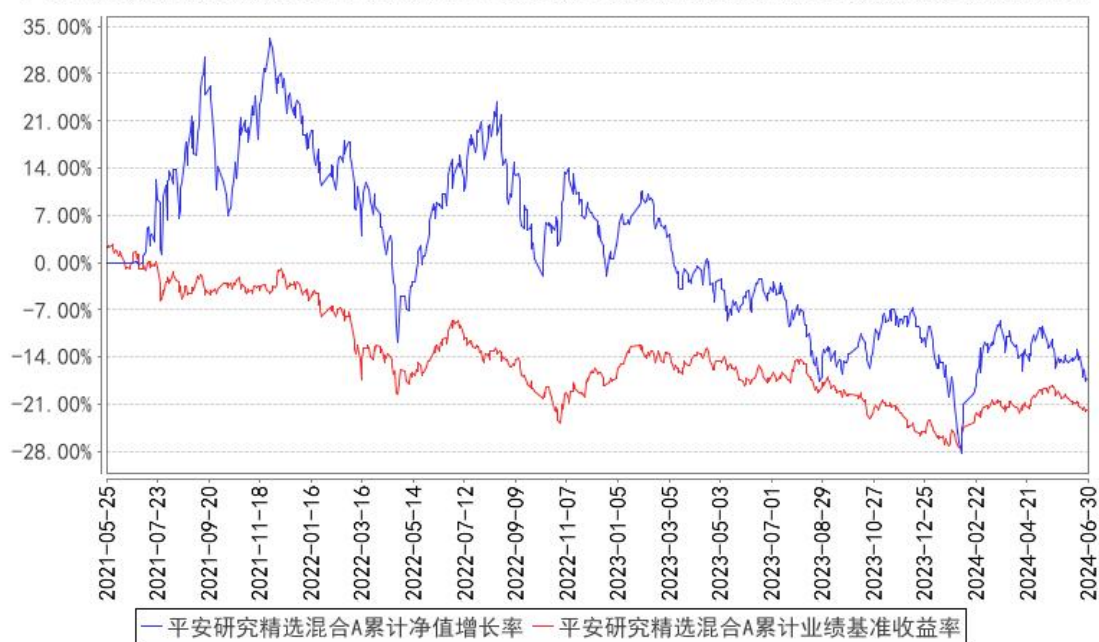
平安研究精选混合A累计净值增长率与同期业绩比较基准收益率的历史走势对比图