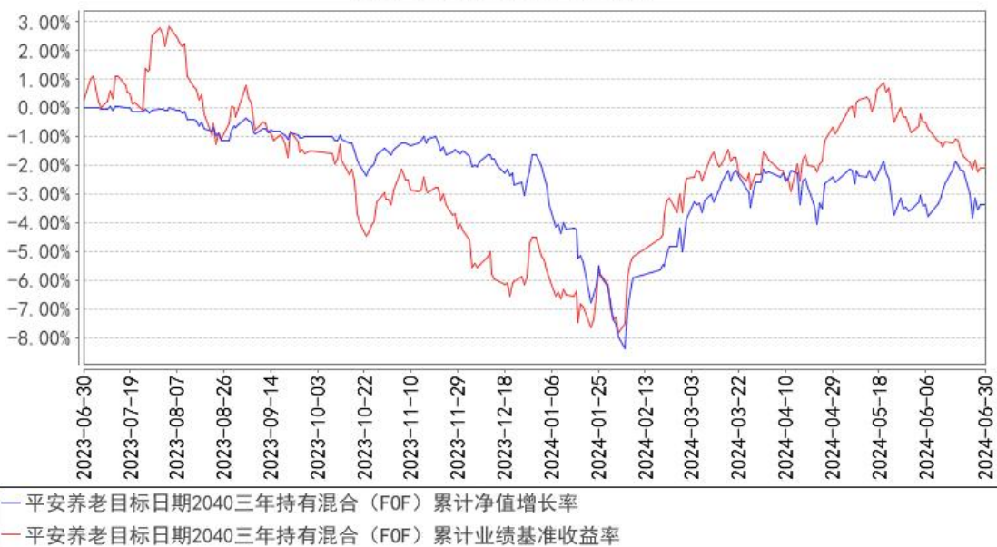
平安养老目标日期2040三年持有混合（FOF）累计净值增长率与同期业绩比较基准收益率的历史走势对比图