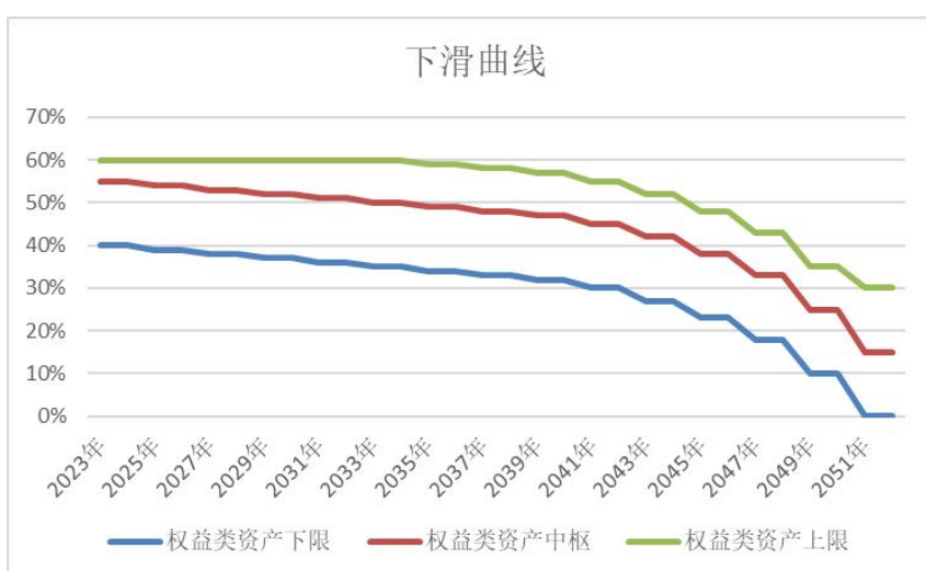
图：本基金当前下滑曲线（Glide Path）

在基金实际管理过程中，本基金具体配置比例由基金管理人根据中国宏观经济情况和证券市场的阶段性变化做主动调整，以求基金资产在各类资产的投资中达到风险和收益的最佳平衡。具体各年份本基金的权益类资产占比按招募说明书的规定执行。经履行适当程序后，基金管理人可根据政策、市场变化等因素调整各年下滑曲线值，实际的下滑曲线可能与招募说明书披露的情况存在差异。