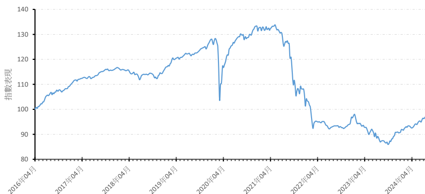
A 美元 (分派)