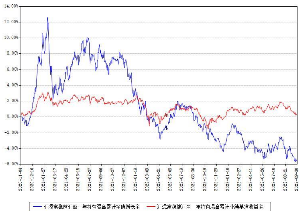
汇添富稳健汇盈一年持有混合累计净值增长率与同期业绩基准收益率对比图