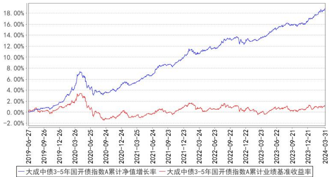
大成中债3-5年国开债指数A累计净值增长率与同期业绩比较基准收益率的历史走势对比图

(二) 自基金合同生效以来基金份额累计净值增长率变动及其与同期业绩比较基准收益率变动的比较