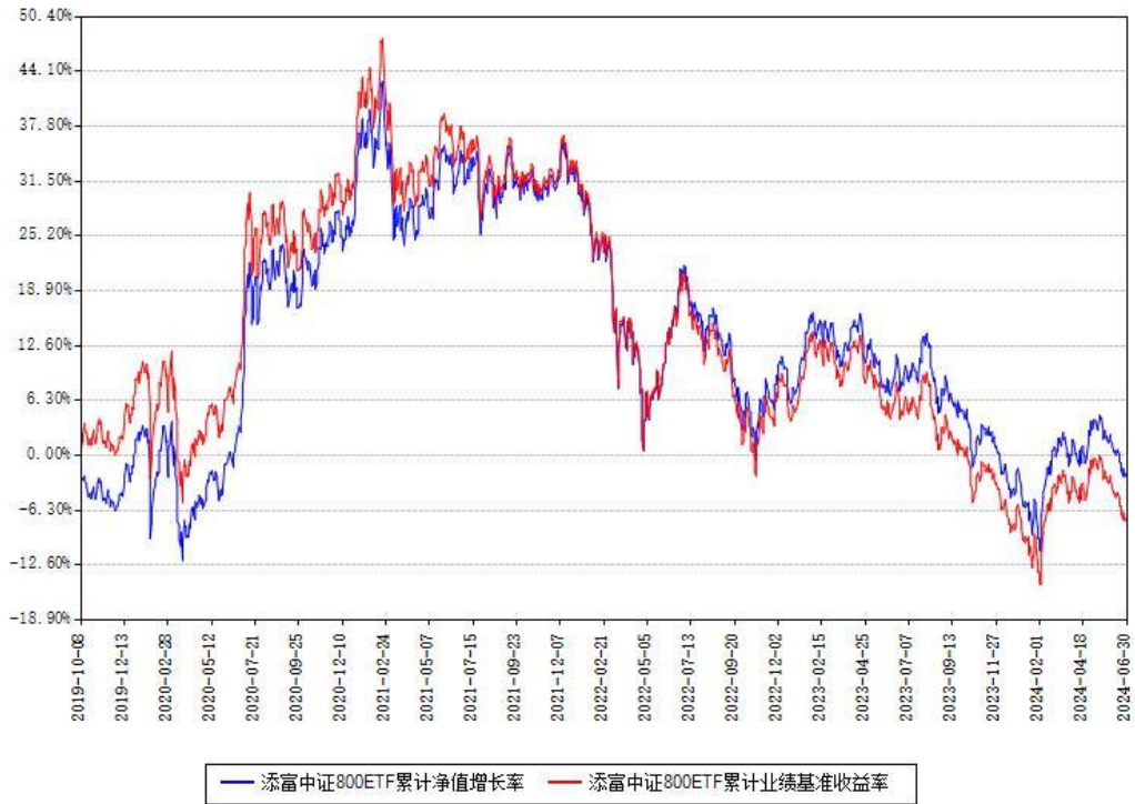
添富中证800ETF累计净值增长率与同期业绩基准收益率对比图