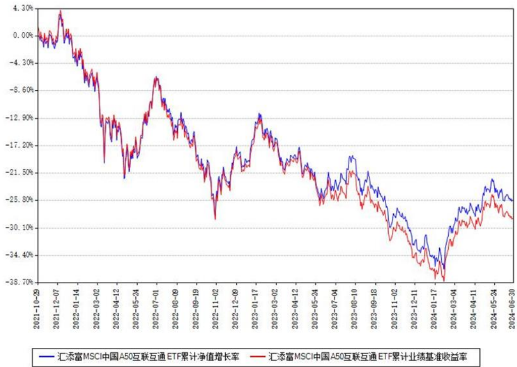
汇添富MSCI中国A50互联互通ETF累计净值增长率与同期业绩基准收益率对比图