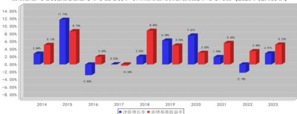
国联安信心增长债券B基金每年净值增长率与同期业绩比较基准收益率的对比图（2023年12月31日）