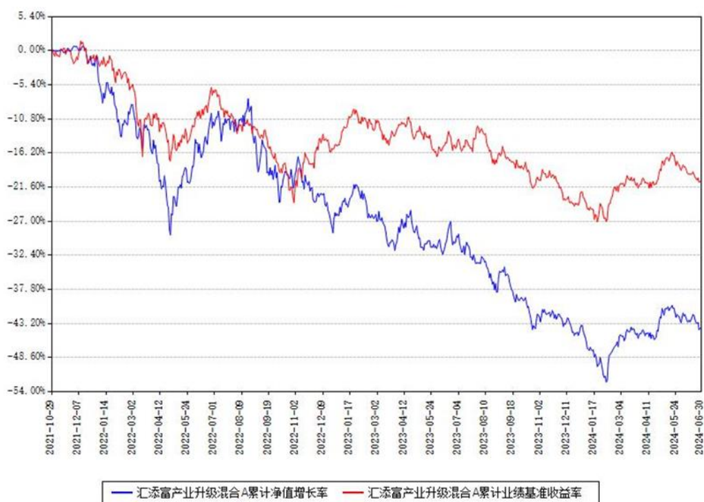
汇添富产业升级混合A累计净值增长率与同期业绩基准收益率对比图

(二) 自基金合同生效以来基金累计净值增长率变动及其与同期业绩比较基准收益率变动的比较图