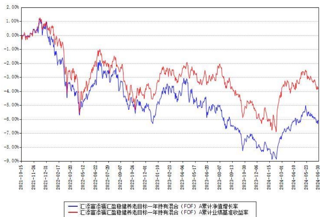
汇添富添福汇盈稳健养老目标一年持有混合 (FOF) A 累计净值增长率与同期业绩基准收益率对比图