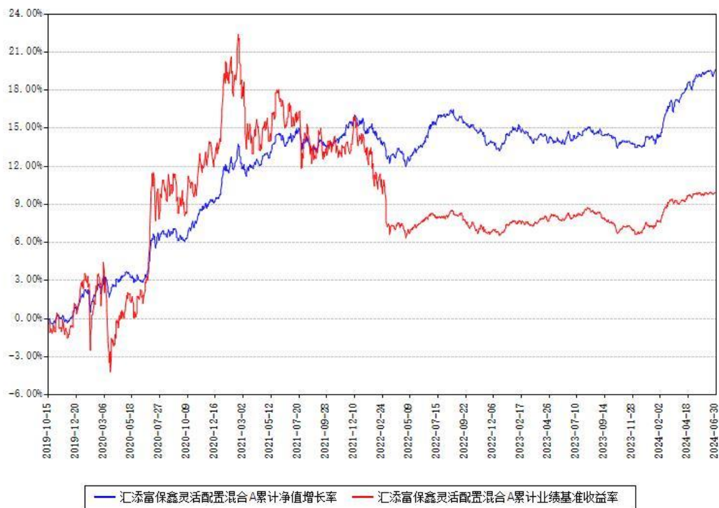
汇添富保鑫灵活配置混合A累计净值增长率与同期业绩基准收益率对比图

(二)自基金合同生效以来基金累计净值增长率变动及其与同期业绩比较基准收益率变动的比较图