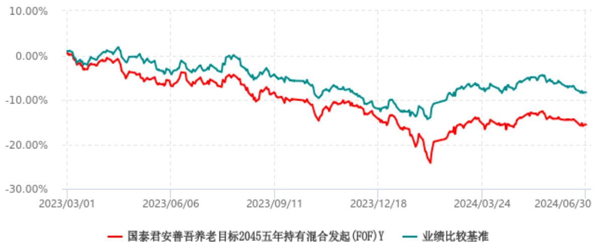
国泰君安善吾养老目标2045五年持有混合发起(FOF)Y累计净值增长率与业绩比较基准收益率历史走势对比图 (2023年03月01日-2024年06月30日)

注：本基金合同生效日为 2022 年 10 月 21 日。本基金从 2023 年 2 月 9 日起新增 Y 类份额，该类份额首次确认日为 2023 年 3 月 1 日。