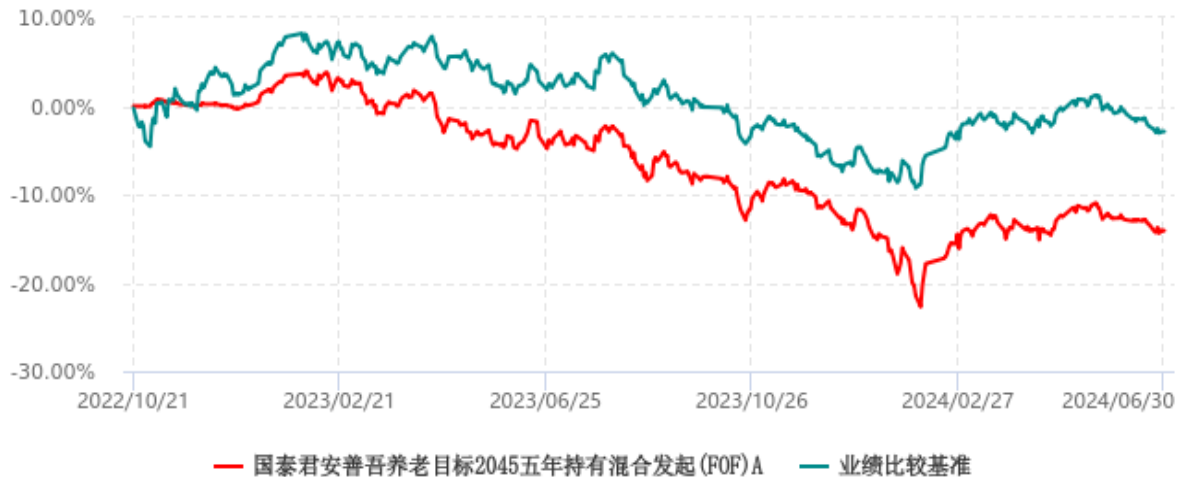
国泰君安善吾养老目标2045五年持有混合发起(FOF)A累计净值增长率与业绩比较基准收益率历史走势对比图 (2022年10月21日-2024年06月30日)