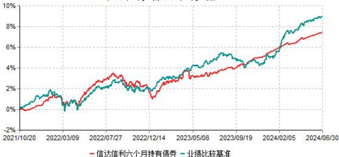
信达信利六个月持有期债券型集合资产管理计划累计净值增长率与业绩比较基准收益率历史走势对比图 (2021年10月20日-2024年06月30日)