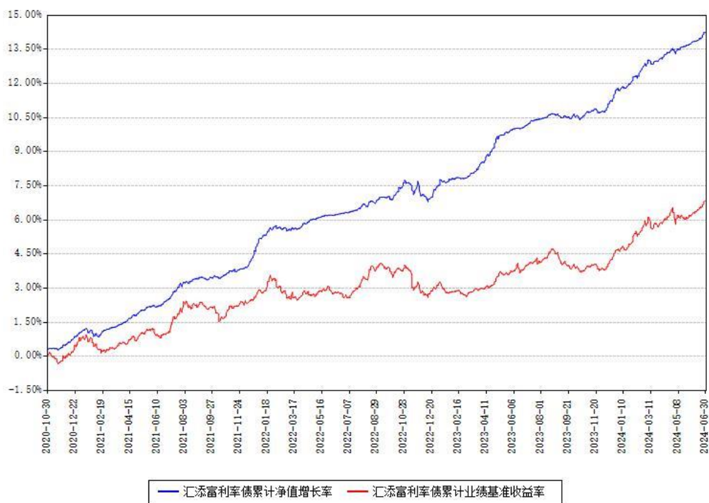
汇添富利率债累计净值增长率与同期业绩基准收益率对比图