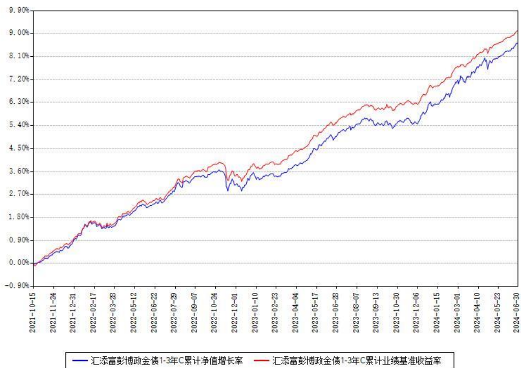
汇添富彭博政金债1-3年C累计净值增长率与同期业绩基准收益率对比图