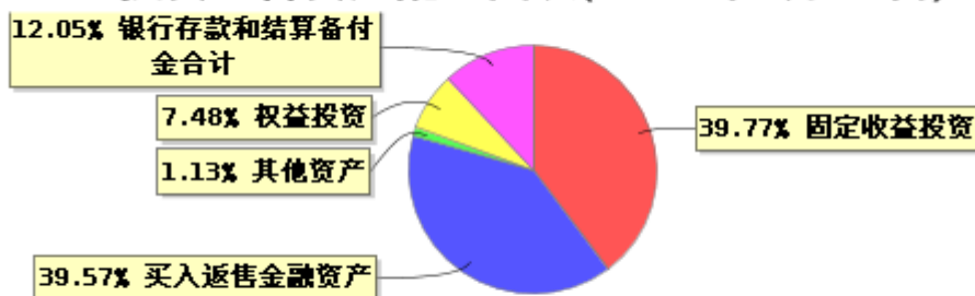
投资组合资产配置图表(2024年6月30日)

● 固定收益投资 ● 买入返售金融资产 ● 其他资产 ● 权益投资 ● 银行存款和结算备付金合计