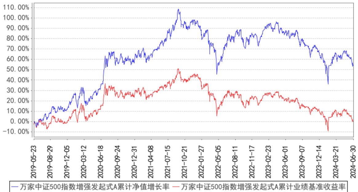
万家中证500指数增强发起式A累计净值增长率与同期业绩比较基准收益率的历史走势对比图

(二) 自基金合同生效以来基金累计净值增长率变动及其与同期业绩比较基准收益率变动的比较