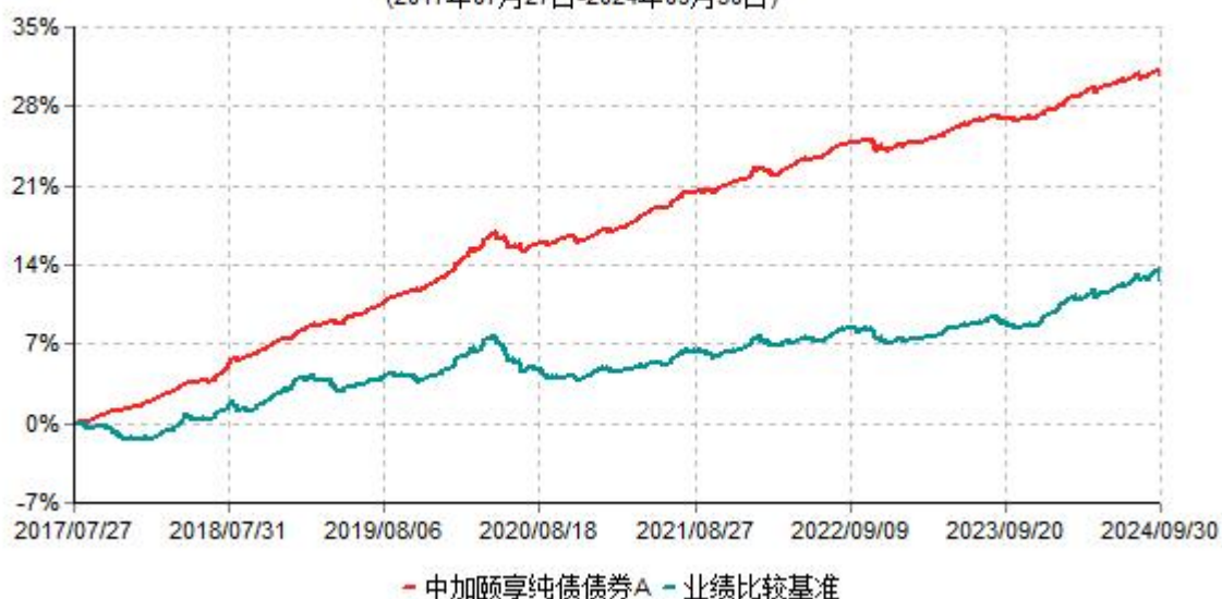
中加颐享纯债债券A累计净值增长率与业绩比较基准收益率历史走势对比图 (2017年07月27日-2024年09月30日)