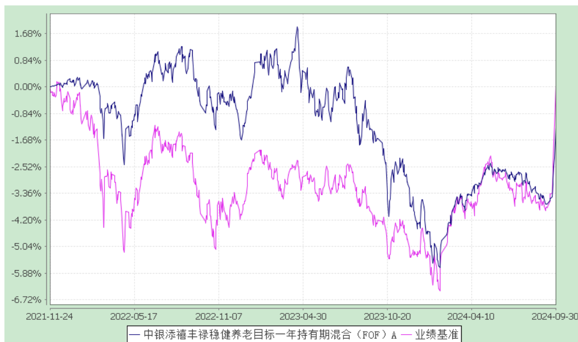
2. 中银添禧丰禄稳健养老目标一年持有期混合（FOF）Y: