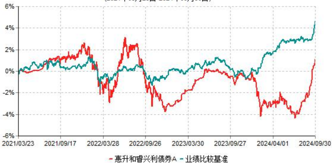
惠升和睿兴利债券A累计净值增长率与业绩比较基准收益率历史走势对比图 (2021年03月23日-2024年09月30日)