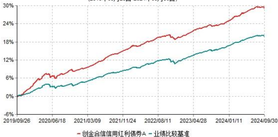
创金合信信用红利债券A累计净值增长率与业绩比较基准收益率历史走势对比图 (2019年09月26日-2024年09月30日)