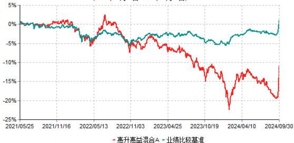
惠升惠益混合A累计净值增长率与业绩比较基准收益率历史走势对比图 (2021年05月25日-2024年09月30日)