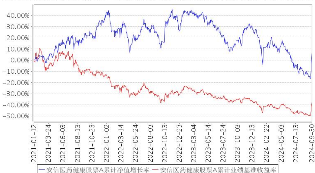
安信医药健康股票A累计净值增长率与同期业绩比较基准收益率的历史走势对比图