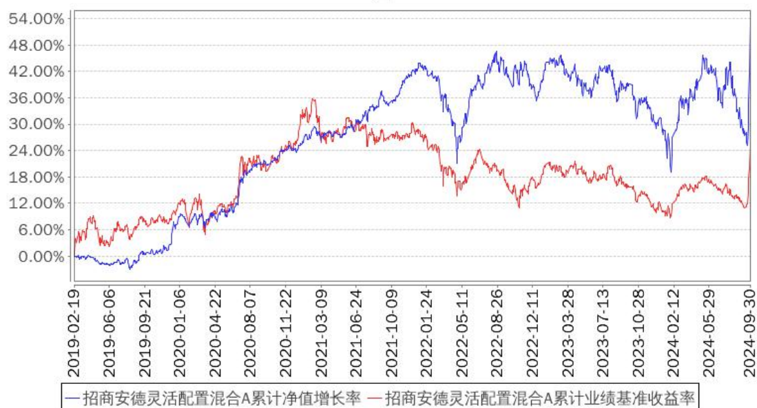
招商安德灵活配置混合A累计净值增长率与同期业绩比较基准收益率的历史走势对比图