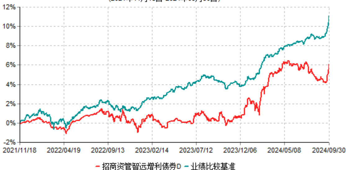
招商资管智远增利债券D累计净值增长率与业绩比较基准收益率历史走势对比图 (2021年11月18日-2024年09月30日)