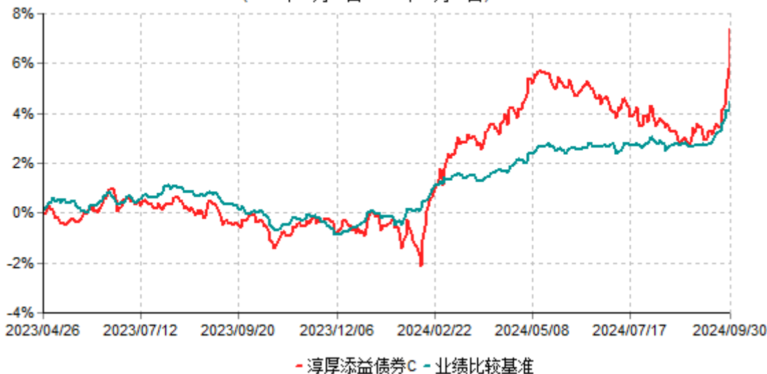
淳厚添益债券C累计净值增长率与业绩比较基准收益率历史走势对比图 (2023年04月26日-2024年09月30日)

注：本基金基金合同生效日为 2023 年 4 月 26 日。按基金合同规定，本基金自基金合同生效起 6 个月内为建仓期。建仓期结束时本基金的各项投资比例均符合基金合同约定。