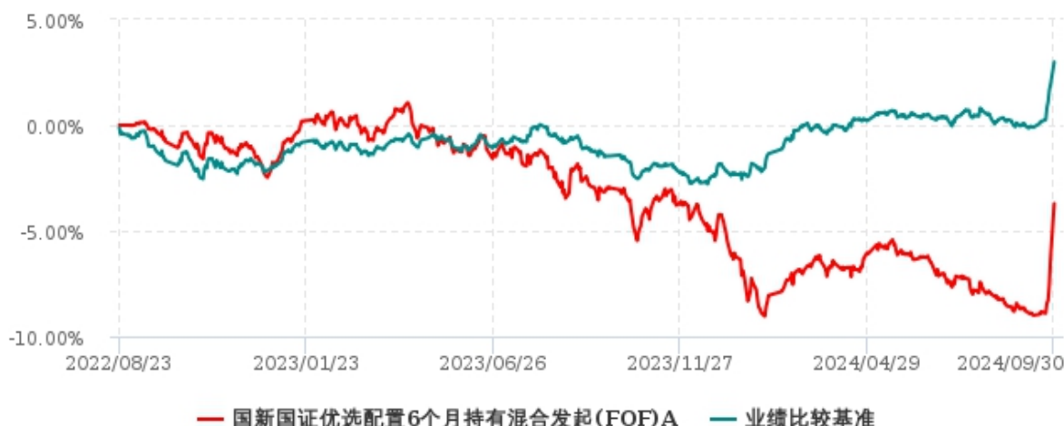
国新国证优选配置6个月持有混合发起(FOF)C累计净值增长率与业绩比较基准收益率历史走势对比图