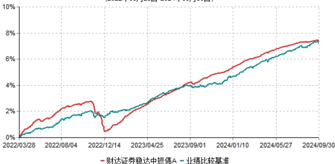
财达证券稳达中短债A累计净值增长率与业绩比较基准收益率历史走势对比图 (2022年03月28日-2024年09月30日)

2022年3月28日，财达证券稳达一号集合资产管理计划正式变更为财达证券稳达中短债债券型集合资产管理计划，即本集合计划。