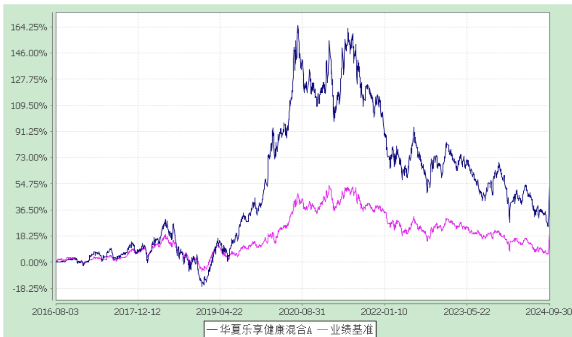
华夏乐享健康混合 C: