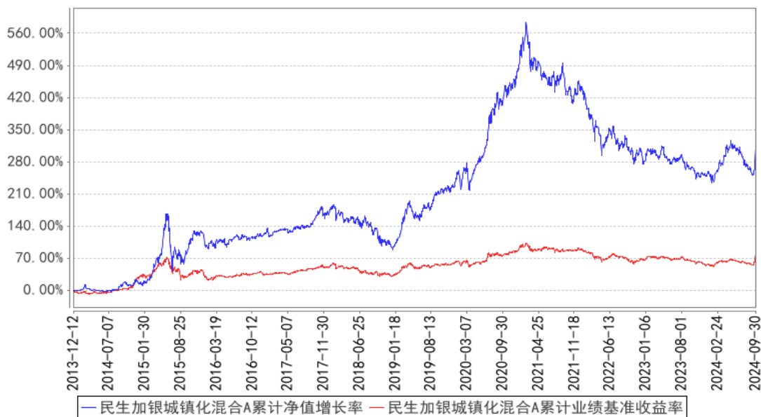
民生加银城镇化混合A累计净值增长率与同期业绩比较基准收益率的历史走势对比图