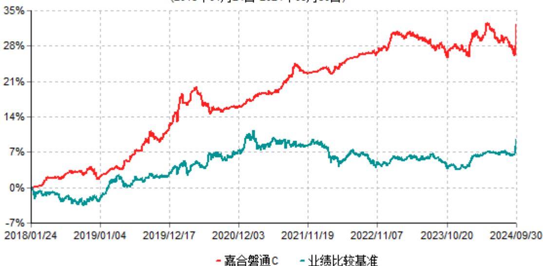
嘉合磐通C累计净值增长率与业绩比较基准收益率历史走势对比图 (2018年01月24日-2024年09月30日)