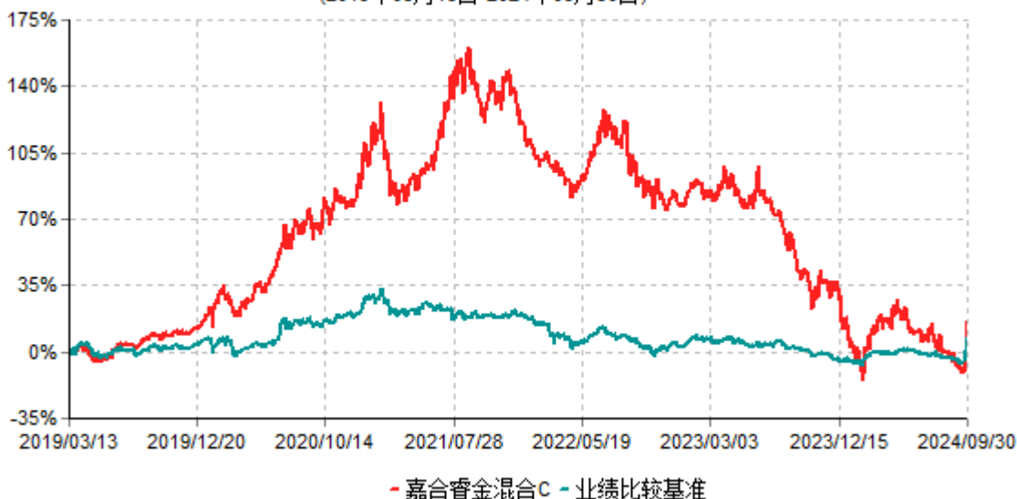
嘉合睿金混合C累计净值增长率与业绩比较基准收益率历史走势对比图 (2019年03月13日-2024年09月30日)