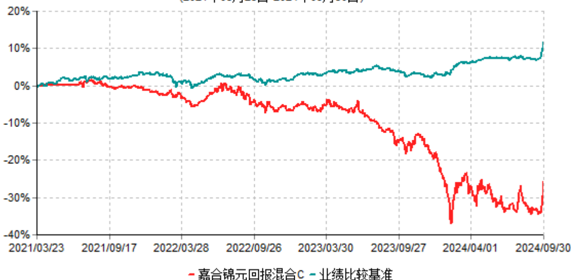
嘉合锦元回报混合C累计净值增长率与业绩比较基准收益率历史走势对比图 (2021年03月23日-2024年09月30日)