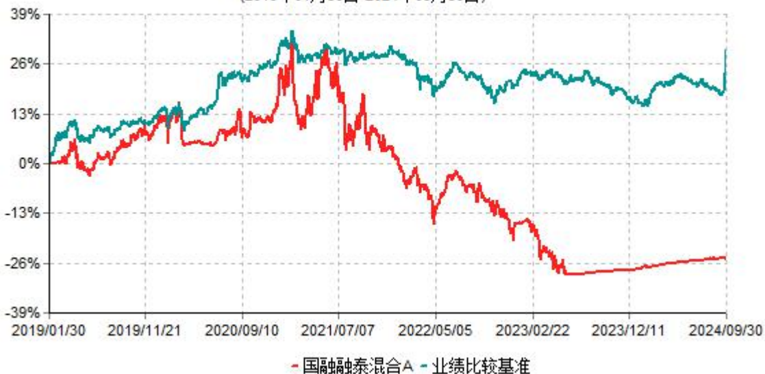
国融融泰混合A累计净值增长率与业绩比较基准收益率历史走势对比图 (2019年01月30日-2024年09月30日)