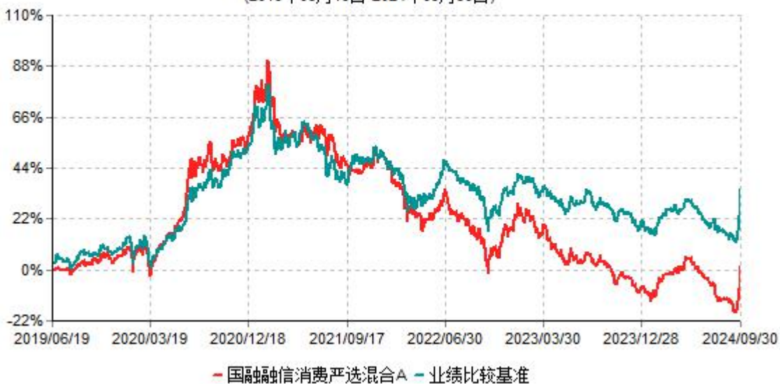
国融融信消费严选混合A累计净值增长率与业绩比较基准收益率历史走势对比图 (2019年06月19日-2024年09月30日)