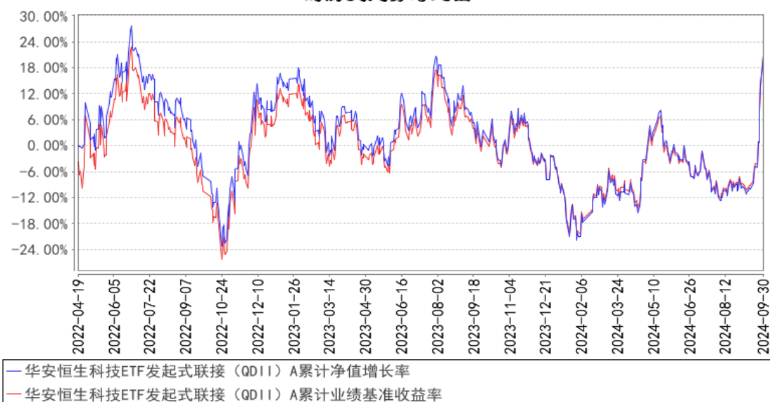
华安恒生科技ETF发起式联接（QDII）A累计净值增长率与同期业绩比较基准收益率的历史走势对比图