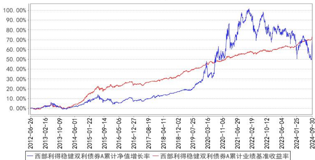
西部利得稳健双利债券A累计净值增长率与同期业绩比较基准收益率的历史走势对比图