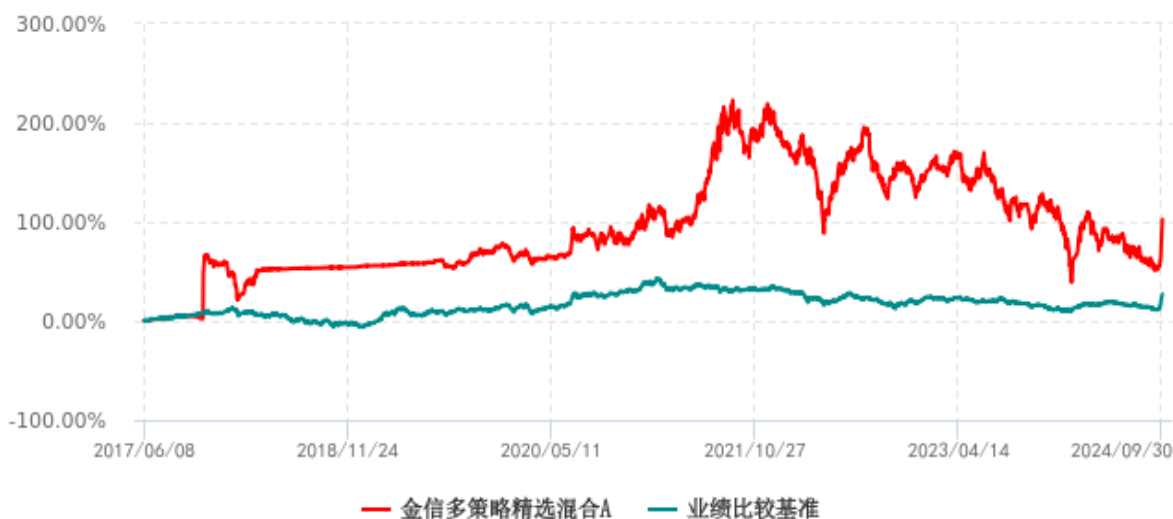
金信多策略精选混合A累计净值增长率与业绩比较基准收益率历史走势对比图 (2017年06月08日-2024年09月30日)