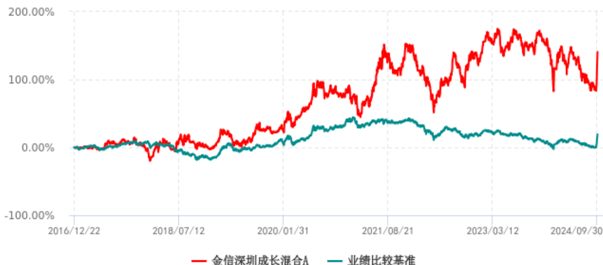
金信深圳成长混合A累计净值增长率与业绩比较基准收益率历史走势对比图 (2016年12月22日-2024年09月30日)