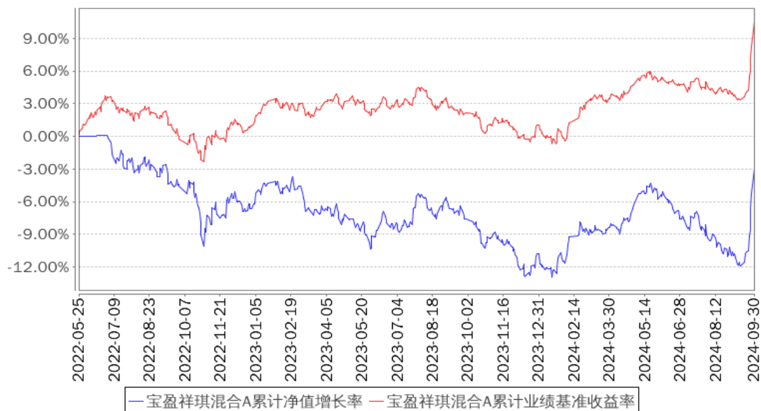
宝盈祥琪混合A累计净值增长率与同期业绩比较基准收益率的历史走势对比图