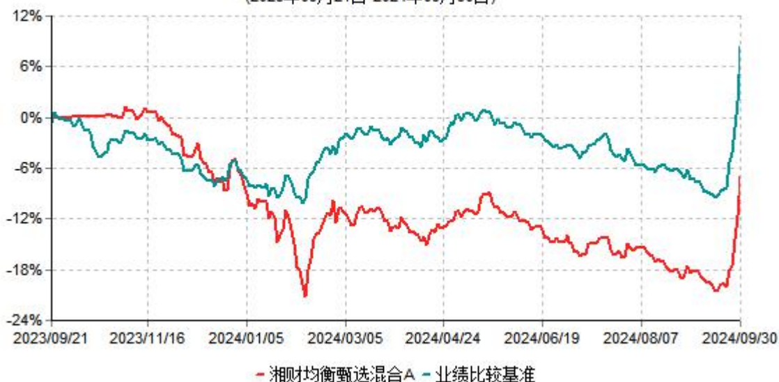
湘财均衡甄选混合A累计净值增长率与业绩比较基准收益率历史走势对比图 (2023年09月21日-2024年09月30日)