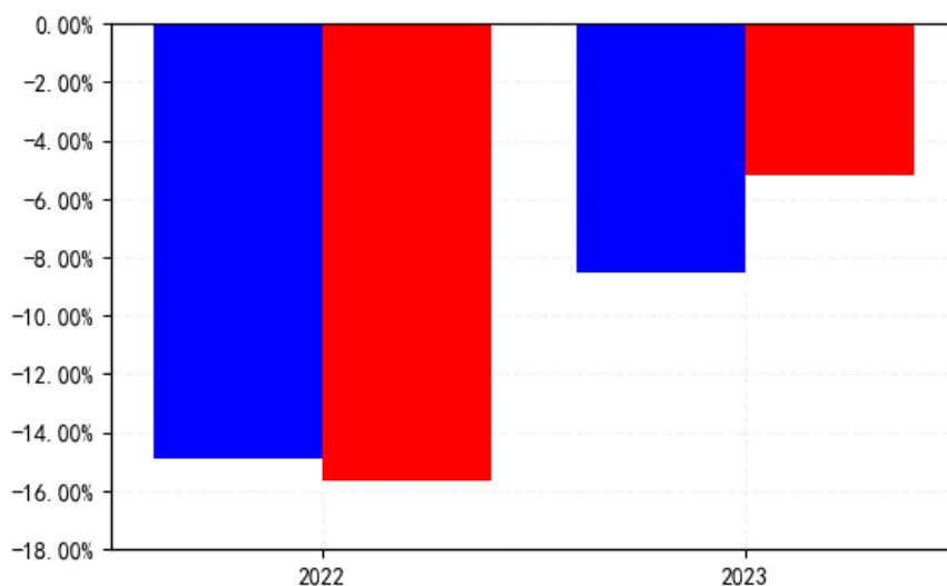
南方专精特新混合C每年净值增长率与同期业绩比较基准收益率的对比图（2023年12月31日）