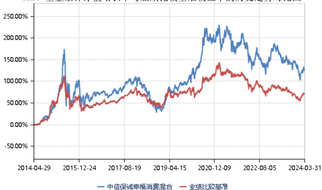
(二) 基金累计净值增长率与业绩比较基准收益率的历史走势对比图