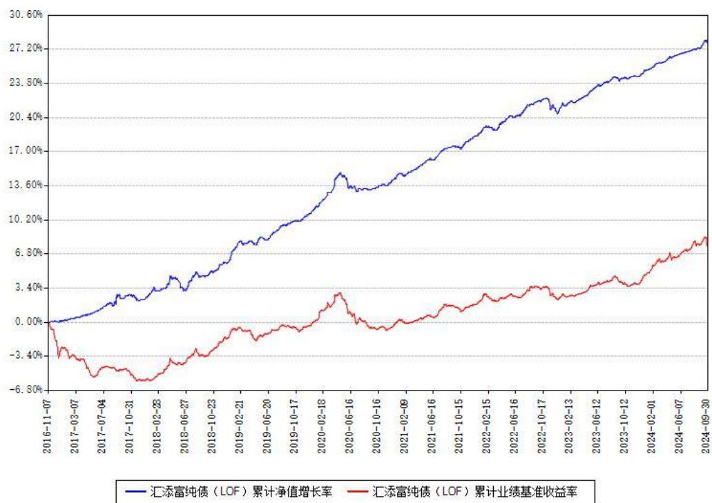
汇添富纯债 (LOF) 累计净值增长率与同期业绩基准收益率对比图