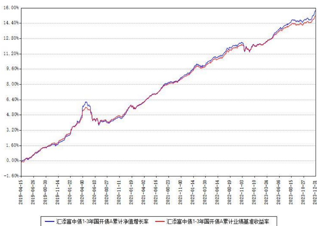
汇添富中债1-3年国开债A累计净值增长率与同期业绩基准收益率对比图

(二)自基金合同生效以来基金累计净值增长率变动及其与同期业绩比较基准收益率变动的比较图