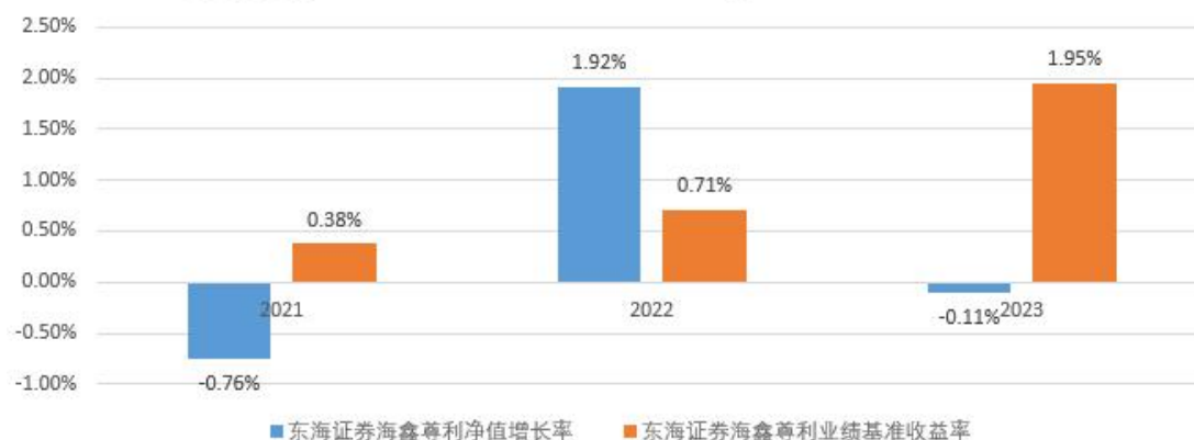
东海证券海鑫尊利每年净值增长率与同期业绩比较基准收益率的对比图

合同生效当年不满完整自然年度，按实际期限（2021年12月6日-2021年12月31日）计算净值增长率。